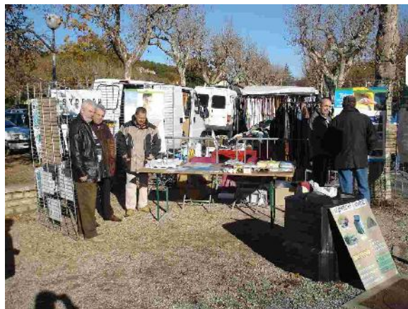
Marché de St Auban (25.11.07)