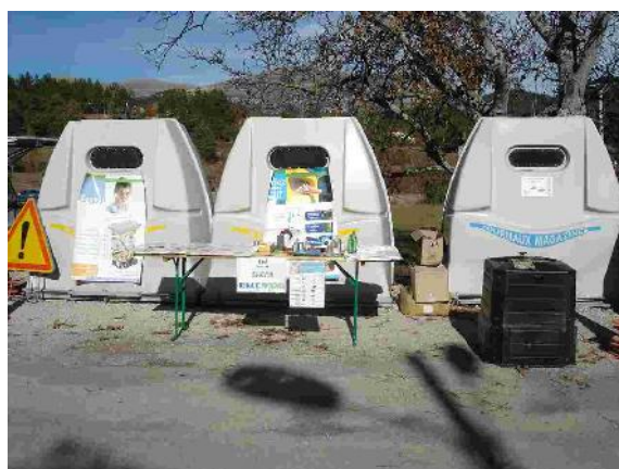
La Palud sur Verdon (28.10.07)