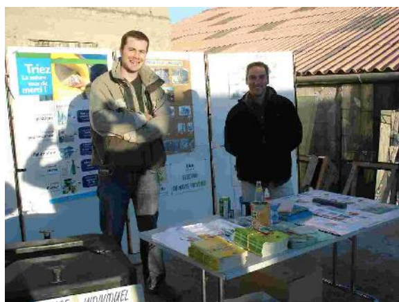
Recyclerie de Haute Povence (10.11.07)