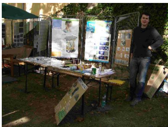
Fête du Parc du Verdon (30.09.07)

Le SYDEVOM poursuit la communication de proximité pour sensibiliser le plus grand nombre de personnes au geste du tri et à la réduction des déchets à la source. Durant ce dernier trimestre, nous avons participé à la fête du Parc du Verdon, au marché paysan de l'environnement de la Palud sur Verdon, à la journée « portes ouvertes » de la recyclerie de Haute Provence à Ste Tulle et au marché de St Auban.