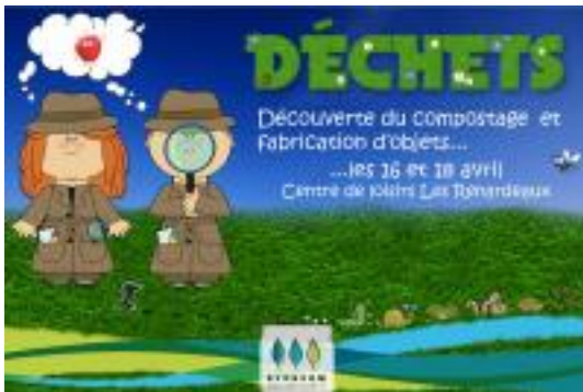
Affiche animation compostage et réduction déchets centre péri-scolaire Pierrevvert avril 2013

Pour compléter les actions déjà engagées ou émergentes sur le territoire concernant la réduction des biodéchets (opération compostage domestique, compostage de village à St Geniez, compostage collectif Pigeonnier-Barbejas, compostage dans les collèges) le SYDEVOM souhaite promouvoir le compostage auprès d'une nouvelle cible : les personnels d'établissements accueillant des enfants (écoles primaires, centres de loisirs et cantines).